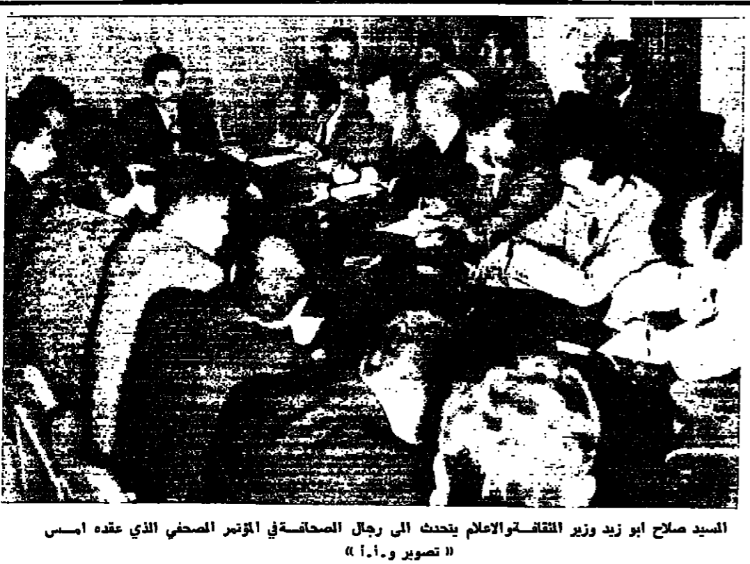
السيد صلاح ابو زيد وزير الثقافة والاعلام يتحدث الى رجال الصحافة في المؤتمر الصحفي الذي عقده امس